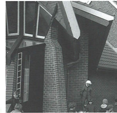
Ecole maternelle de Haspres - P. Marchand et S. Théret, architectes. (Exemple de photo utilisée)

Se référer au verso de la fiche de présentation générale.