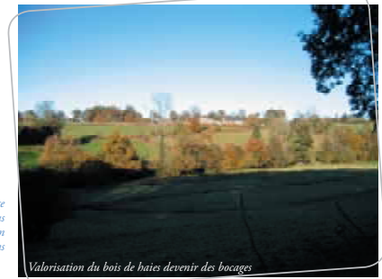
Valorisation du bois de haies devenu des bocages

La valorisation des haies du bocage ne doit pas être envisagée que sous l'aspect bois-énergie, mais de façon transversale et dans ses implications sur le paysage Document CAUE de la Manche