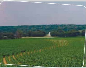
La plaine de Versailles : construction d'un nouveau paysage, préservation et valorisation de l'espace ouvert agricole.

Les espaces agricoles peuvent être des « espaces de respiration » dans des territoires très urbanisés, dans une logique de préservation, ou à l'inverse s'inscrire comme « paysage de reconquête » de fonds de vallées envahis par la forêt.