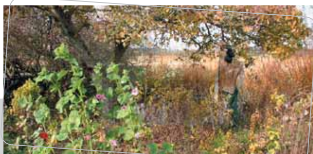
conception graphique: A. Milhaud CAUE du Loir