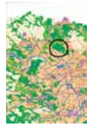
ENS des coteaux et vergers de Saint Prix (Val d'Oise) : élaboration d'un Plan de Paysage, création d'un ENSIL, signature de la charte régionale pour la protection de la biodiversité Document CAUE du Val d'Oise

20 % de la production agricole en France est orientée vers la qualité en s'appuyant sur des territoires et des produits définis, des savoir-faire, et génère le plus souvent un paysage identifiable au produit et réciproquement.